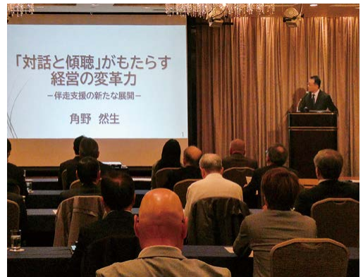
熱心に解説を聴く受講者