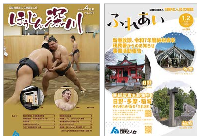
受賞会の会報誌 江東西法人会「ほうじん深川」(左)と 日野法人会「ふれあい」