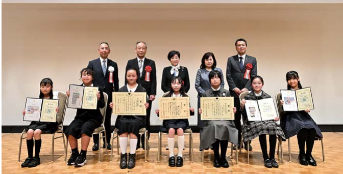
受賞者全員で記念撮影