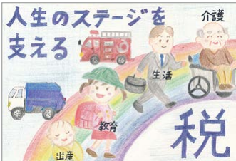
【荒川法人会】 村中 杏実さん(6年生)