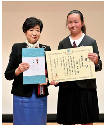
小池百合子東京都知事と都知事賞の大坪千隼さん(右)

の作品も税への理解を深め、真摯に表現に向き合った多様性に富む内容」と評価した。 表彰式には小池百合子東京都知事も駆けつけ挨拶。各受賞者に表彰状と副賞が授与され、記念撮影を行った。会場入口には各会から推薦された作品全48点が掲示され、参加者の関心を集めた。