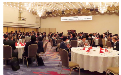
推進状況報告等を聴く参加者

からキャンペーンについての説明があ り、8月末の進捗状況は、東法連ベ ースで新規企業数が37.2%である ものの、新契約件数が49.6%と順 調に推移していることが報告された。