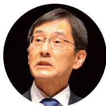
あいさつをする 住澤整国税庁長官

第39回法人会全国大会・群馬大会が、10月18日、高崎市の高崎芸術劇場で開催された。当日は全国から約1500名、うち東京からは約190名の会員が参加した。