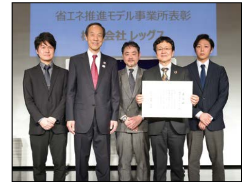
株式会社 レッグス