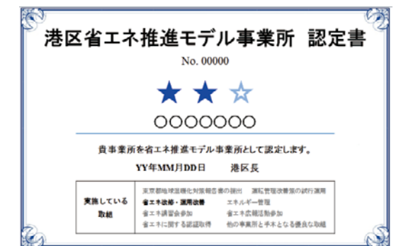
港区省エネ推進モデル事業所認定書 (見本)