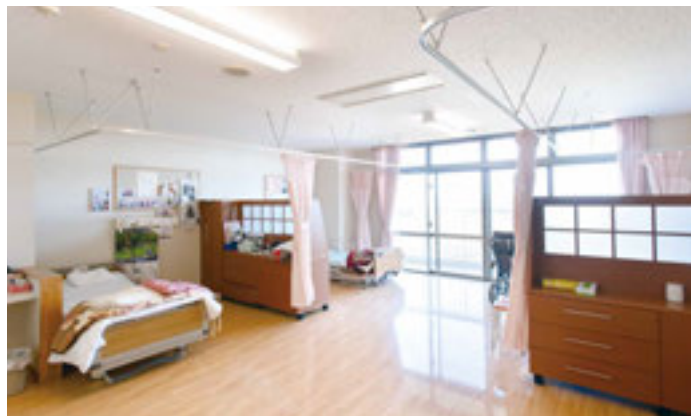
利用者が安心して暮らせる、明るく清潔感溢れるホーム内観