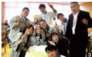
1 子どもたちとお年寄りが触れ合う。多世代の交流を目指す 2 専門のスタッフが親身になってケアをする 3 夏祭りが大好きというターミナルケアの入所者の方と

昭和23年、匝瑳市生まれ。家の事情から地元の職場として九十九里ホームに就職。事務職畑の役職を経て昭和60年から理事長に。年2日、大好きな地元の祭りの日以外は休むことなく施設にいるという。