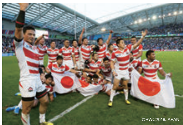
約3万人の観客が見守る中、34-32の劇的勝利を飾った2015大会の日本代表

アジアで初めて開催されるRWC。大切なのは単なる経済効果だけを追いかけて、一時的なラグビーブームを創出するだけで終わらせてはいけないということだ。母国開催を足掛かりに、ラグビーの人気やトップリーグの認知・集客アップにつなげることは勿論だが、大会をきっかけにして有形・無形のものを含め、「社会、地域、人々の心に残るもの」がレガシーであるとするれば、ラグビーが文化のひとつとなり、ラグビーを通して、人として大切なものを学ぶ機会となる。——これこそが、RWCが日本で開催される最大のレガシーなのだろう。