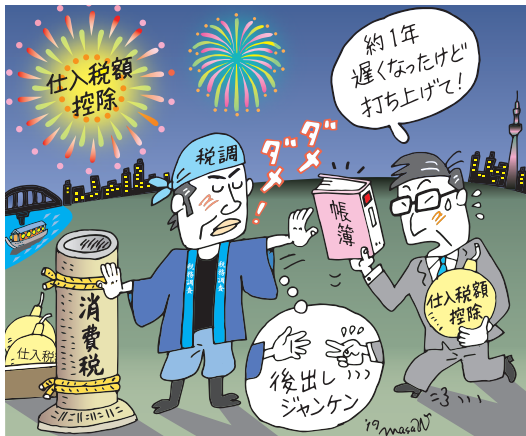
イラスト 渡辺 正義

もし、時間がかかるようであれば、 やむを得ない事情の事実を調査官にわ かるよう説明をしなければなりません。 特に、請求書は保存しているが、取 引の具体的な内容を示す納品書等の保 存がきちんとされていない場合、それ に代わる受領書等で立証できなければ、 仕入税額控除が否認されてしまうので 注意が必要です。