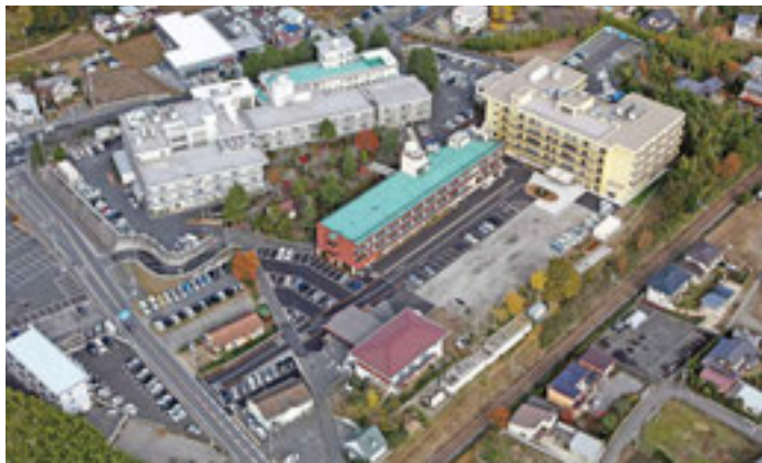
徒歩圏に医療、福祉、教育など6施設が連携を取りながら展開する

A そうです。でも、当法人にとっても私自身にとってもこれは大きな転機であり、大変な苦難でしたが、今にして思えば本当にいい経験をしたと思っています。それまでは労使という意識がほとんどなかったわけですが、これをきっかけに、もう少し組織的に運営していこうという風土が生まれました。経営的にもこのままでは潰れてしまうということで、何をすべきか