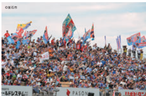
6530人の観客が詰めかけたスタジアムには大漁旗がはためいた

1964年生まれ。早稲田大学教育学部卒。早稲田大学GWラグビークラブ所属。1989年ベースボール・マガジン社入社。ラグビーマガジン編集部、週刊ベースボール編集部勤務を経て、1997年よりラグビーマガジン編集長。国内外のビッグゲームを制覇し、ワールドカップは1999年より5大会すべて取材している。