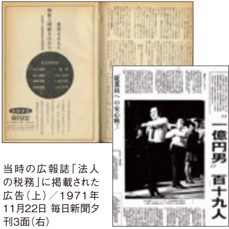
当時の広報誌「法人の税務」に掲載された広告(上) / 1971年11月22日 毎日新聞夕刊3面(右)

昭和40年代前半、日本では好景気が続き経済大国としての地位を獲得していたが、その一方で中小企業の倒産が相次いでいた。法人会でも、会員の大半を占める中小企業の「経営の安定化」という悩みを大きな課題と感じて